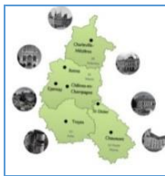
Bassin Universitaire de Reims Champagne - Ardenne